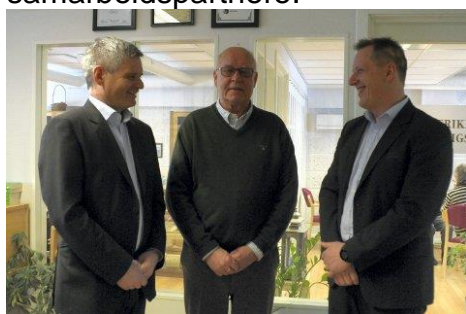
Besøk fra Hønefoss sparebank

Sentralens samarbeidsorganisasjoner, Ringerike kommune gjennom læringscenteret for voksne – ringerikskjøkken – kulturavd – slt koordinator – kommuneoverlege – folkehelsekoordinator – hospiceavd – helsesøster – hjemmetjenesten - omsorgssentra og kreftkoordinator. Videre er Politiet, Friomsorgen, Ringerike brann- og redningstjeneste, Advokater i Ringerike, NAV, Nettverksgruppen, Ringerike og omegns Hørselslag, Askeladden bussreiser og Ringeriksbadet gode samarbeidspartnere.