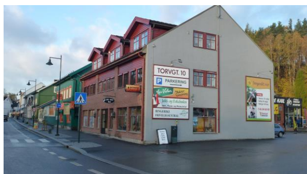
Torvgt. 10, annen etasje. Orgnr. 971309741