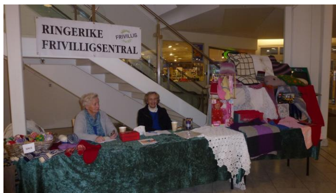
Julemesse på Kuben