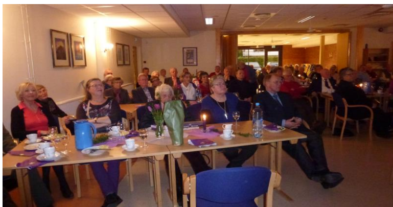
Feiring av den internasjonale frivillighetsdagen 2014

På vegne av styret og administrasjonen ønsker Ringerike Frivilligsentral å takke alle frivillige hjelperne for innsatsen som gjøres til beste for beboere i Ringerike kommune. Det er en innsats vi alle kan være stolte av!