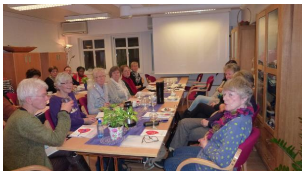
Kurs i palliativ omsorg

Kurs: Kurs i palliativ omsorg over fem kvelder ledet av kreftkoordinator i Ringerike kommune. 18 deltagere registrert.